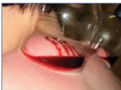
Abbildung 5: Blutiges Schröpfen im Bereich des M. trapezius bds