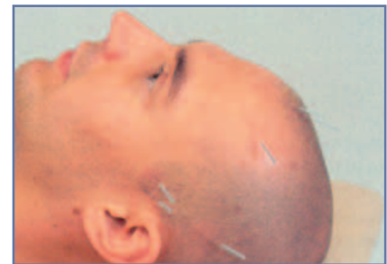
Abbildung 2: Neue Schädelakupunktur nach Yamamoto (YNSA)