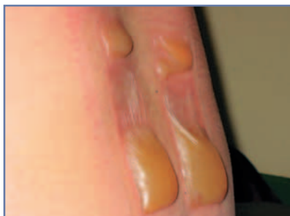
Abbildung 6: Kantharidenpflasterbehandlung über beiden Ileosakralgelenken

wähnt, beispielsweise als Ganzkörperhyperthermie, Tiefenhyperthermie oder lokoregionale Hyperthermie.