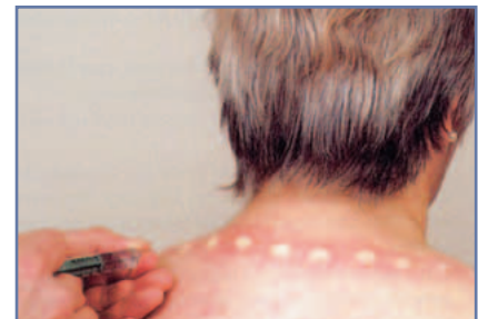
Abbildung 3: Neuraltherapeutische Segmenttherapie

pie können die geschädigten Nervenstrukturen durch Injektion eines Lokalanästhetikums intervallmässig unterbrochen werden, um eine normale neuronale Erregbarkeit wiederherzustellen.