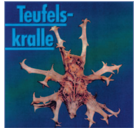
Abbildung 1: Harpagophytum procumbens – Teufelskrallenwurzel kann Gelenk- und Knochenschmerzen lindern.

Die Neuraltherapie stellt eine effiziente Schmerz-, Regulations- respektive Umstimmungstherapie dar. Mit der therapeutischen Lokalanästhesie ( Injektionen an Nerven ) und der Neuraltherapie nach Huneke können überempfindliche Körperareale wieder in einen normalen Erregungszustand gebracht werden. Andauernde Reizung peripherer Nerven können überproportionale Schmerzsymptomaten hervorrufen. Diese Sensibilisierung kann im Sinne der neuronalen Plastizität auf allen Stufen des Nervensystems entstehen. Mit der Neuralthera-